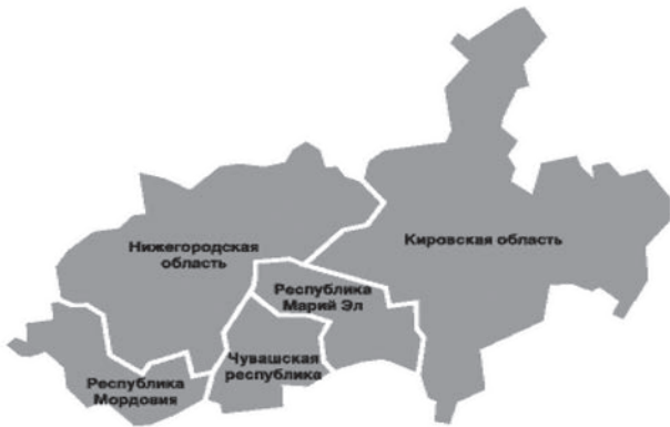
Рис. 1. Волго-Вятский регион

Ежегодно уровень официальной заболеваемости иерсиниозами в России остается невысоким и не отражает истинную ситуацию [2]. Причиной этого, в большей степени, является гиподиагностика инфекции. В связи с полиморфизмом клинических проявлений больные иерсиниозом часто лечатся не у инфекционистов, а у врачей других специальностей (гастроэнтерологов, ревматологов, эндокринологов и др.), каждый из которых ставит «свой» диагноз, поэтому назначается неадекватное лечение, в частности, не проводится этиотропная терапия [4]. Следует обратить внимание на определенные проблемы лабораторной диагностики. Специфическая диагностика иерсиниозной инфекции включает в себя серологические и бактериологические методы. У тест-систем, используемых в практической медицине для диагностики иерсиниозов, достаточно низкая чувствительность [2]. Бактериологический метод мало информативен в связи с низкой частотой роста культуры Yersinia enterocolitica и Yersinia pseudotuberculosis . Серьезной проблемой остаются неблагоприятные исходы перенесенного иерсиниоза и псевдотуберкулеза, такие как хронизация инфекционного процесса и формирование системных аутоиммунных заболеваний [2, 8].