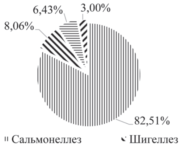
Рис. 3. Структура острых кишечных инфекций бактериальной этиологии в Кировской области в 2009–2014 гг. (n = 3561)

В структуре кишечных инфекций установленной бактериальной этиологии иерсиниозная инфекция в данном регионе занимает 4-е место (рис. 3).